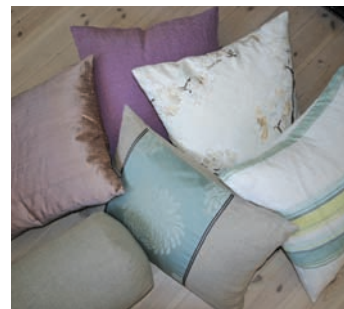
Litt hjemmesydd og litt kjøpt.

Da var det bare å skride til verket og lage en arealdisponering, hvor en deler rommet inn i soner. Som vanlig er en god plan mer en halve jobben i alle prosjekter. En detaljert plantegning ble utarbeidet i forhold til møblering og belysning – dette ga oss perfekt oversikt og forhindret feilkjøp av møbler. Det er så mye lettere å ommøblere på papiret, mot å flytte møblene rundt i rommet □