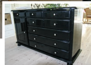
Kontorsone med god oppbevaringsplass.