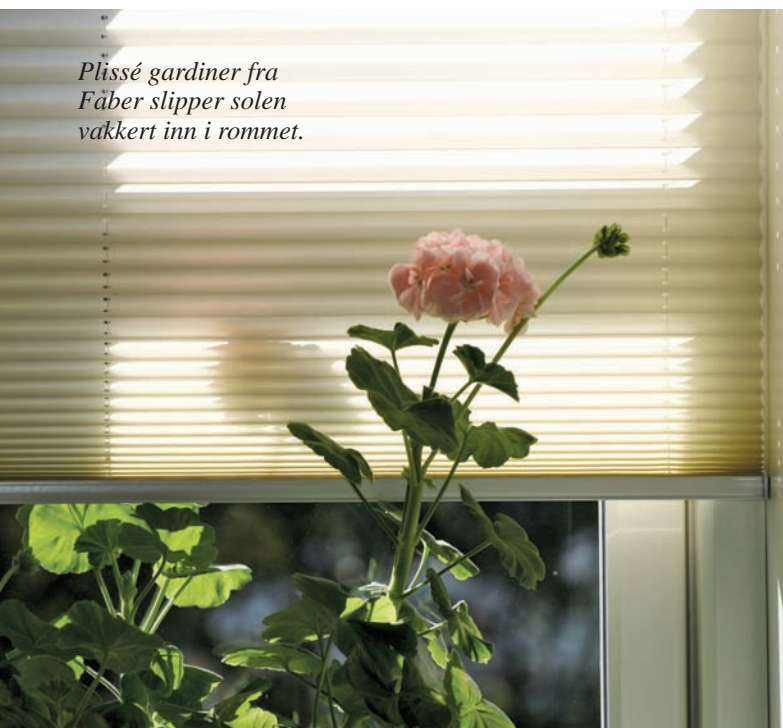
Plissé gardiner fra Fäber slipper solen vakkert inn i rommet.