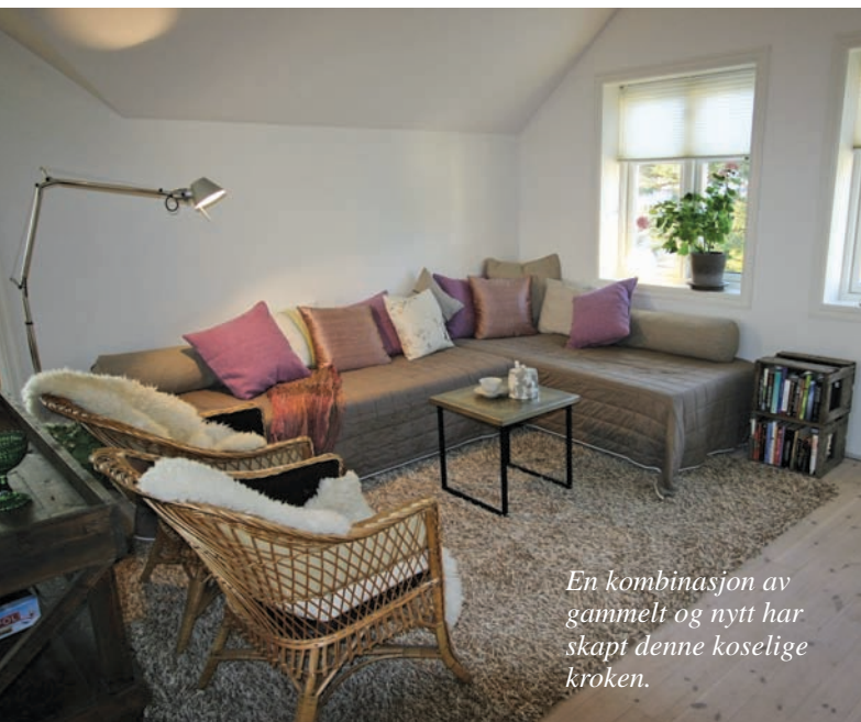
En kombinasjon av gammelt og nytt har skapt denne koselige kroken.