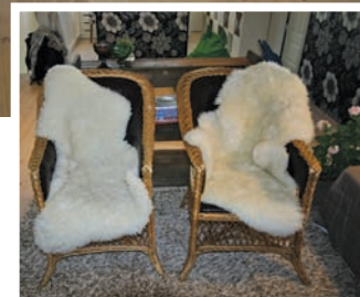
Mormors 76 års gamle stoler fikk et løft med nye saueskinn.

Faber plisségardiner – Fargerike Ås, DÅBO Son Sengetepper – Ellos Opems Pulverlakkering i Ås Puter, lys, lykter, silketeppe fra Lama – Fargerike Ås, DÅBO i Son Benkeplate til overskap – Haaheim & Brynildsen Snekkerbedrift AS Bord og rustikk hylle – Home & Cottage Stålampe – Artemide BigCat Sakkosekk - Room Skrivebord og hyller – Ikea Teppe - Gulvx Designers Guild Tapet – Fargerike Ås, DÅBO Son Kreativ interiørkonsulent – DÅBO i Son